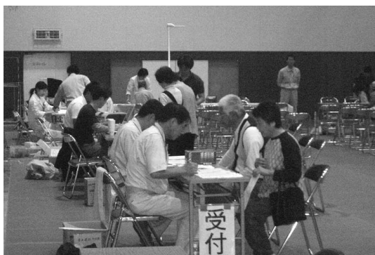
総合健診(吾川地区)

四月十二・十三・十四日のがん検診については、精密検査が必要な方のみお知らせしています。がん検診を受けられた方で、現時点で通知のない方は、異常がありませんのでご安心ください。