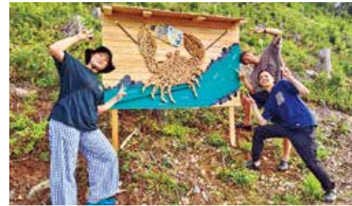
ニヨウウッドさんと学生さんが作ったオスジェ(西尾レントオールとの協働の森(スルーの森))