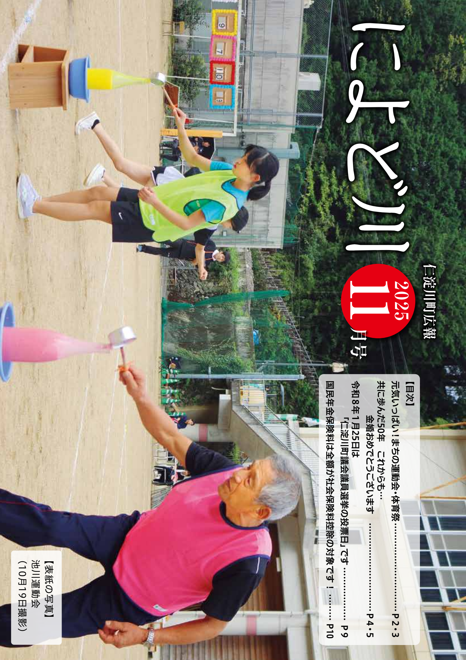
【表紙の写真】 池川運動会 (10月19日撮影)