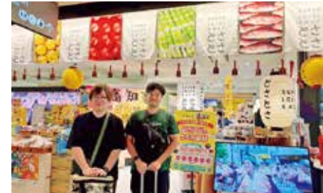
大阪の高知県アンテナショップ「とさとさ」で仁淀川町をPR。