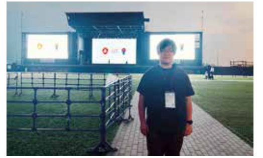
大阪万博で仁淀川町をPR

協力隊として、町の魅力を伝える活動に取り組むとともに、仁淀川町ならではの資源を生かした蒸溜所の準備を進めています。本年度内のオープンを目指して、地域の方々と力を合わせながら一歩ずつ形にしているところです。これからも町の発展に少しでも貢献できるよう、地域の皆さまとのご縁を大切にしながら活動を続けていきたいと思ひます。