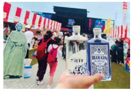
大阪万博で仁淀川町のジン「BLUE GIN IMUA」もPR。