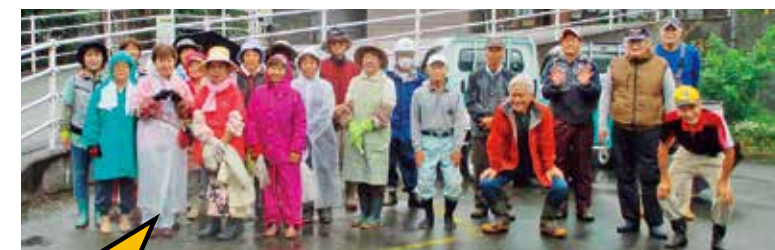
ボランティアに参加した会員

シルバー事業普及啓発促進月間に合わせて、小雨が降る中、会員22人と事務局職員3人が参加して、旧吾川中グラウンド周辺の草刈りと松の木剪定、校舎下の公園の草刈りのボランティア活動を実施しました。この活動は、平成18年にシルバー人材センターが発足してから毎年実施しています。