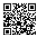
高知県 ホームページ