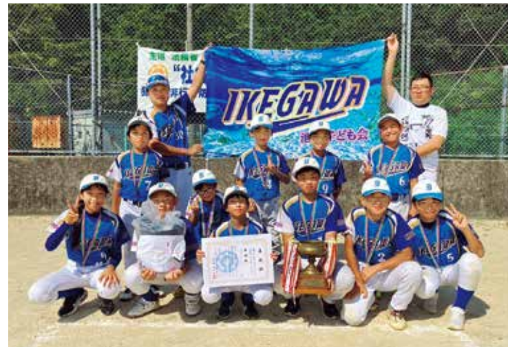
活躍した選手たち

涙していた選手も表彰式では胸を張り、準優勝を喜んでいました。選手からは「次は優勝したい」との意気込みが聞かれました。