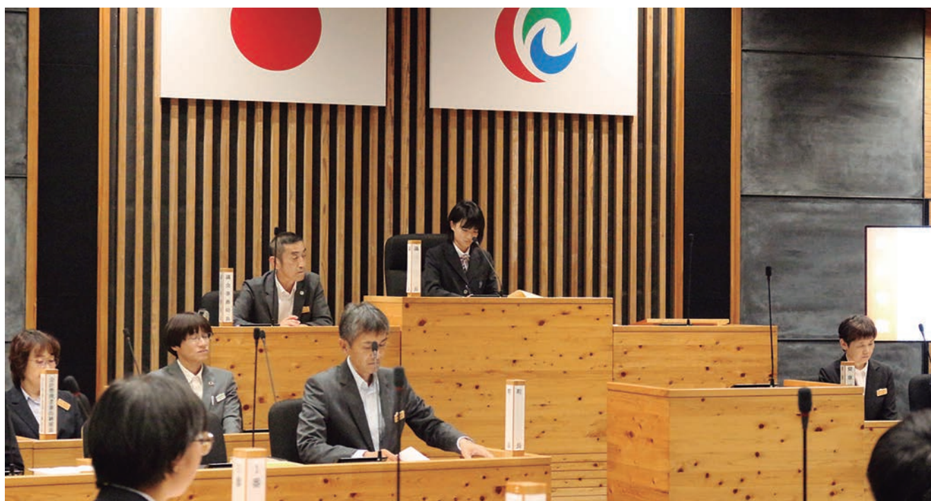
子ども議会の様子

『年をとつても未来は変えられる』という希望を胸に、町民の力を信じ、「自律した大人の町」の実現に全力で取り組んでまいります。