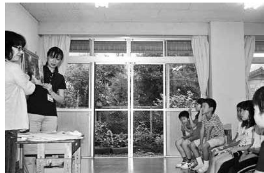
おはなし会の様子

大崎、池川の子ども教室と、夏休みに入ってから、仁淀教育事務所でおはなし会を行いました。