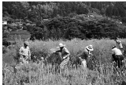
菜の花の収穫作業

Bスタイルプロジェクトでは、この秋からも菜の花栽培を継続します。菜の花栽培に参加してくださる方を募集中です。