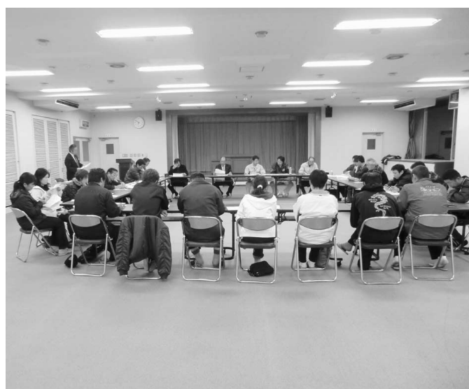
12月14日第一回検討委員会