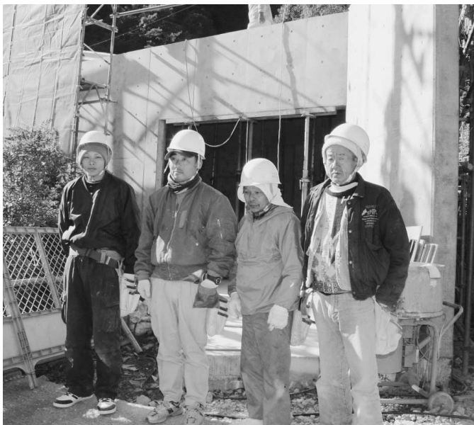
多目的ホールで働く地元大工さん