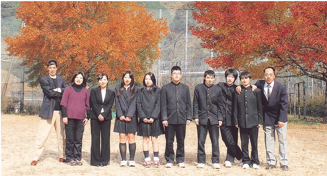
最後の卒業生と先生