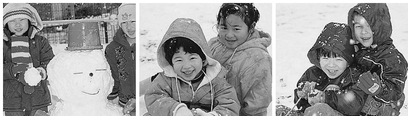
雪だるま作りやそり滑り。楽しかったよ

雪に子どもたちは大喜びで、大きな雪だるまをいくつも作ったり、そりで滑ったり、寒さで手足が痛くなるまで遊んだ日のひとこまです。笑顔、笑顔。「子どもは風の子元氣な子」