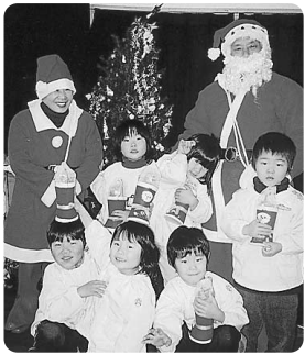
サンタさんと一緒に

おじいさんサンタは、毎年ボランティアで久喜から来てくださっています。いつもありがとうございます。