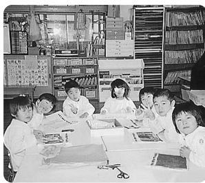
勉強ごっこ。 ちよっと眠い？

食後は少し眠くなったりしますが、三月の卒園のころまでには体も慣れてくると思います。昼寝の代わりに勉強ごっこをして楽しんでいきます。卒園まで、後わずかになりました。元気に過ごしてもらいたいと思います。