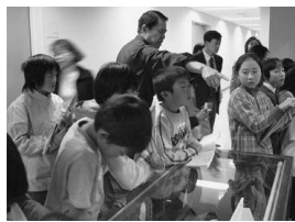
高知新聞社印刷工場の見学

ぼく達は、別府小学校の五年生と一緒にNHK高知放送局と高知新聞東雲センターへ行きました。