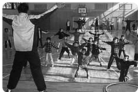
元気いっぱい体を動かす子どもたち