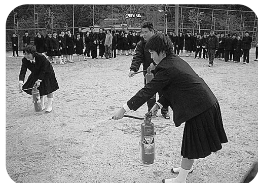
消火器を使っでの訓練