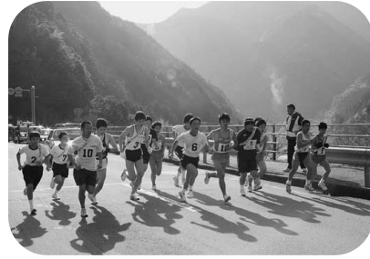
スタート（寺村西浦）

一月十五日、吾川・仁淀川・上仁淀川駅伝競走大会が、十六チームの参加で行われました。 前半は寺村西浦から上仁淀川橋までの二区間、後半は上仁淀川橋から役場本庁までの四区間、二十二・八キロのコースで健脚を競いました。 天候にも恵まれ、沿道からたくさんの方々の声援を受けながら、選手は力いっぱい走りを見せました。 吾川の部では高吾北広域が、仁淀川の部では三年連続で春野町Aが、上仁淀川の部では仁淀高校ソフトボール部が優勝しました。