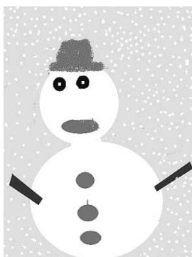
「かわいい雪だるま」