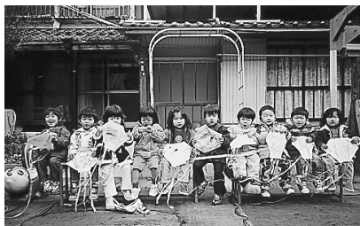
手作りのたこで～す！

こま回しではうまく回らず、何度も何度もチャレンジし、年齢ごとに工夫をしながらとても頑張りました。