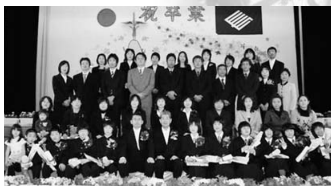
長者小学校 10人・3月20日