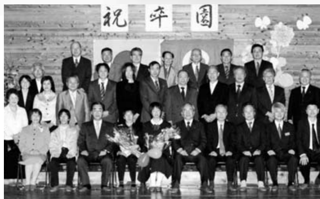
池川自然学園 2人・3月15日