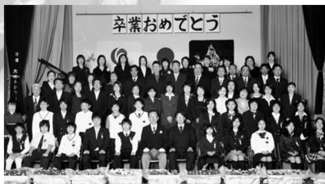
大崎小学校 20人・3月20日