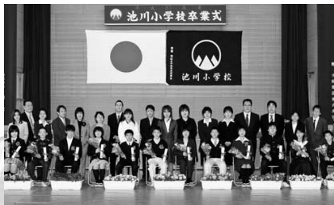
池川小学校 12人・3月20日