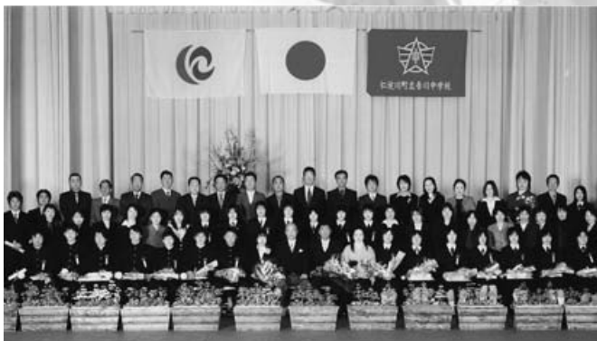
吾川中学校 21人・3月15日