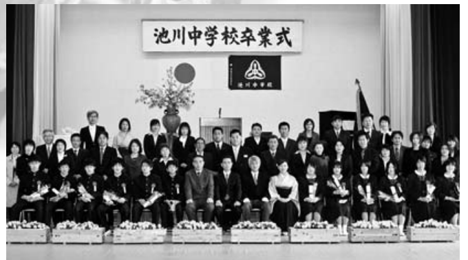
池川中学校 13人・3月14日