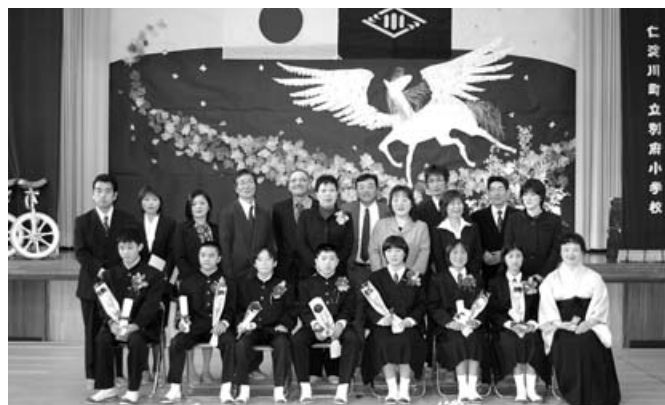
別府小学校 7人・3月20日