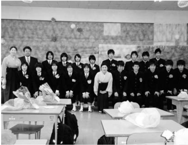
仁淀中学校 18人・3月14日