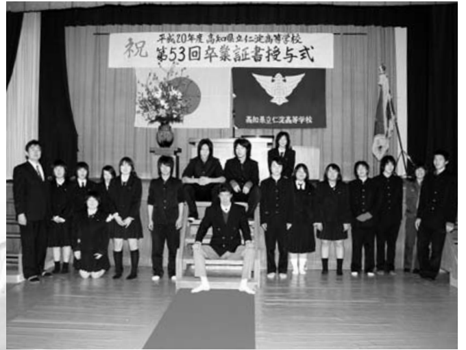
仁淀高校 15人・3月1日