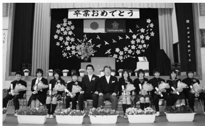
名野川小学校 9人・3月20日