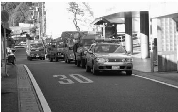
池川地区は総合支所からスタート