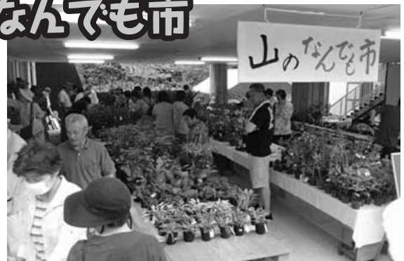
特に人気のあった山野草

ちらし寿司、新茶などの販売も大好評で、梅雨のうつつうしさを吹き飛ばす楽しい時間となりました。