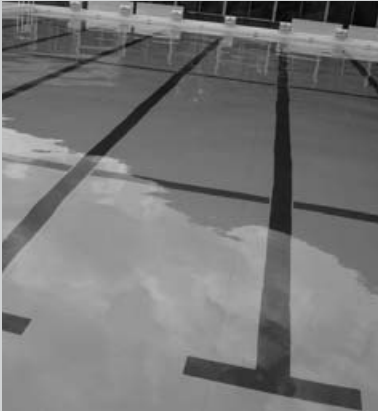
いよいよ夏本番! 今年も子どもたちの歓声 があふれています