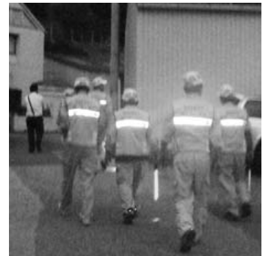
夜間防犯パトロール