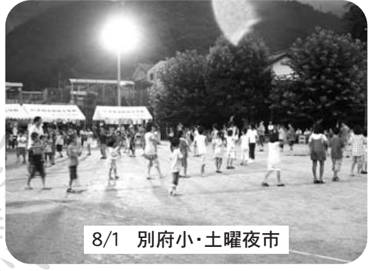
8/1 別府小・土曜夜市