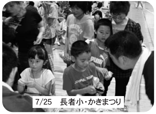
7/25 長者小・かきまつり