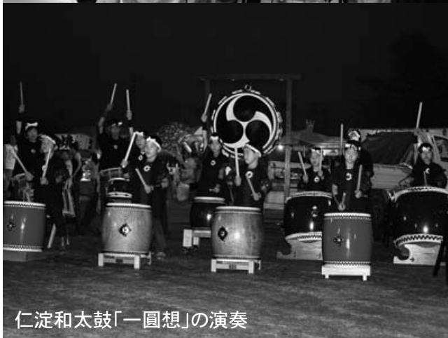
仁淀和太鼓「一圓想」の演奏