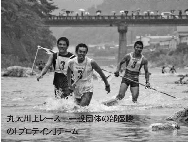
丸太川上レース 一般団体の部優勝の「プロテイン」チーム