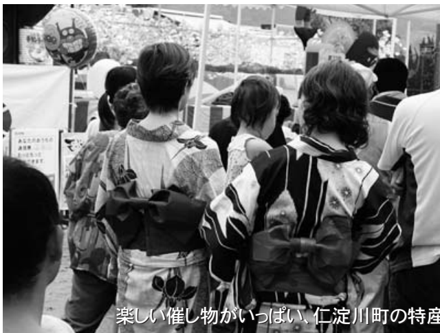
楽しい催し物がいっぱい、仁淀川町の特産品を販売する出店もならび大盛況でした。