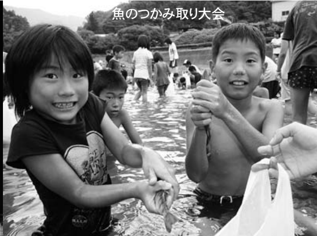
魚のつかみ取り大会

あいにくの悪天候でしたが、参加者は皆元気がいっぱい！ 子どもも大人も年に一度のお祭りを思い切り楽しみました。