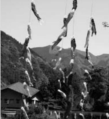
爽やかな風の中、元気に泳ぐ鯉のぼり。 (中津溪谷 4月14日撮影)