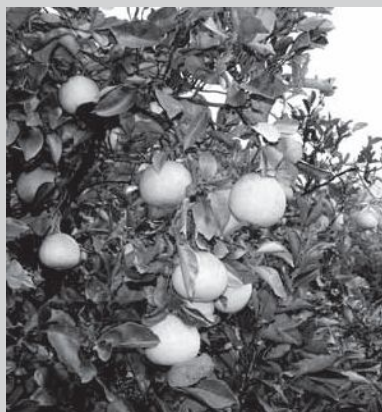
粉雪舞う仁淀川町で、おいしい文旦が育っています。 (崎ノ山 12月16日撮影)